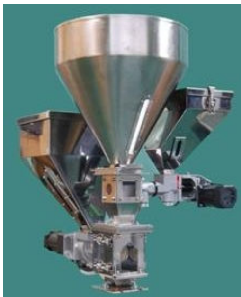
画像は3種混合フィーダーです。